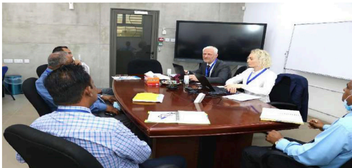
Danish Investigators at ICAC in 2022

“Whenever a case reaches the Further Investigation stage, it is understood that the ICAC must refer the matter to the Director of Public Prosecution (DPP) upon completion of the investigation”